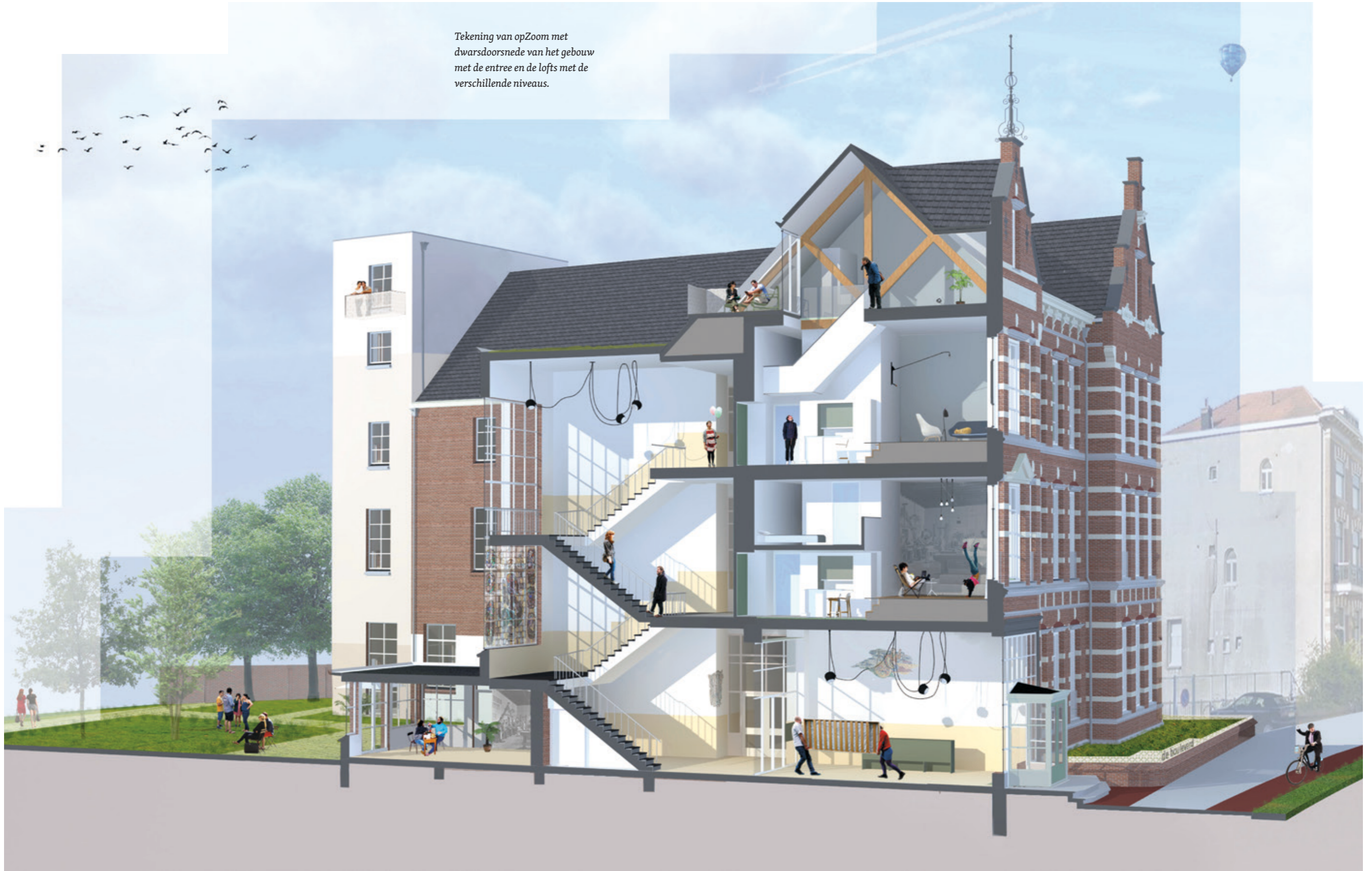
Tekening van opZoom met dwarsdoorsnede van het gebouw met de entree en de lofts met de verschillende niveaus.