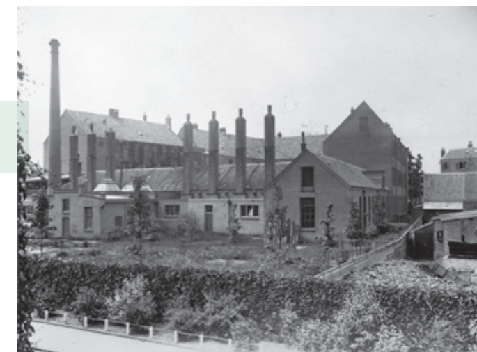
Achterzijde van het schoolcomplex rond 1930 met de schoorstenen van de smederij. Links de 25 meter hoge schoorsteen, opgericht ten behoeve van de stoommachine die volgens overlevering grotendeels door de leerlingen zelf was gebouwd.