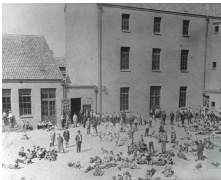
De binnenplaats rond 1900. Duidelijk zichtbaar is de sobere architectuur van de achterbouw alsook het hoogteverschil tussen het gebouw en de werkplaatsen. In het midden de poort aan de westzijde die toegang bood tot de binnenplaats via een gang vanaf de Boulevard Heuvelink.

Zo is de Ambachtsschool een typisch voorbeeld van architectuur uit de late negentiende eeuw, die met zijn voorname pronkgevel het moderne, sober vormgegeven gebouw en de werkplaatsen erachter camoufleert. Tegelijkertijd doet het feit dat Tellegen zo weinig over het uiterlijk van het gebouw zegt vermoeden dat het hem er niet om ging om de schone schijn op te houden. Uit het verdere verloop van zijn carrière is duidelijk dat hij juist zeer begaan was met de (fysieke) leefomstandigheden van de arbeidersklasse.