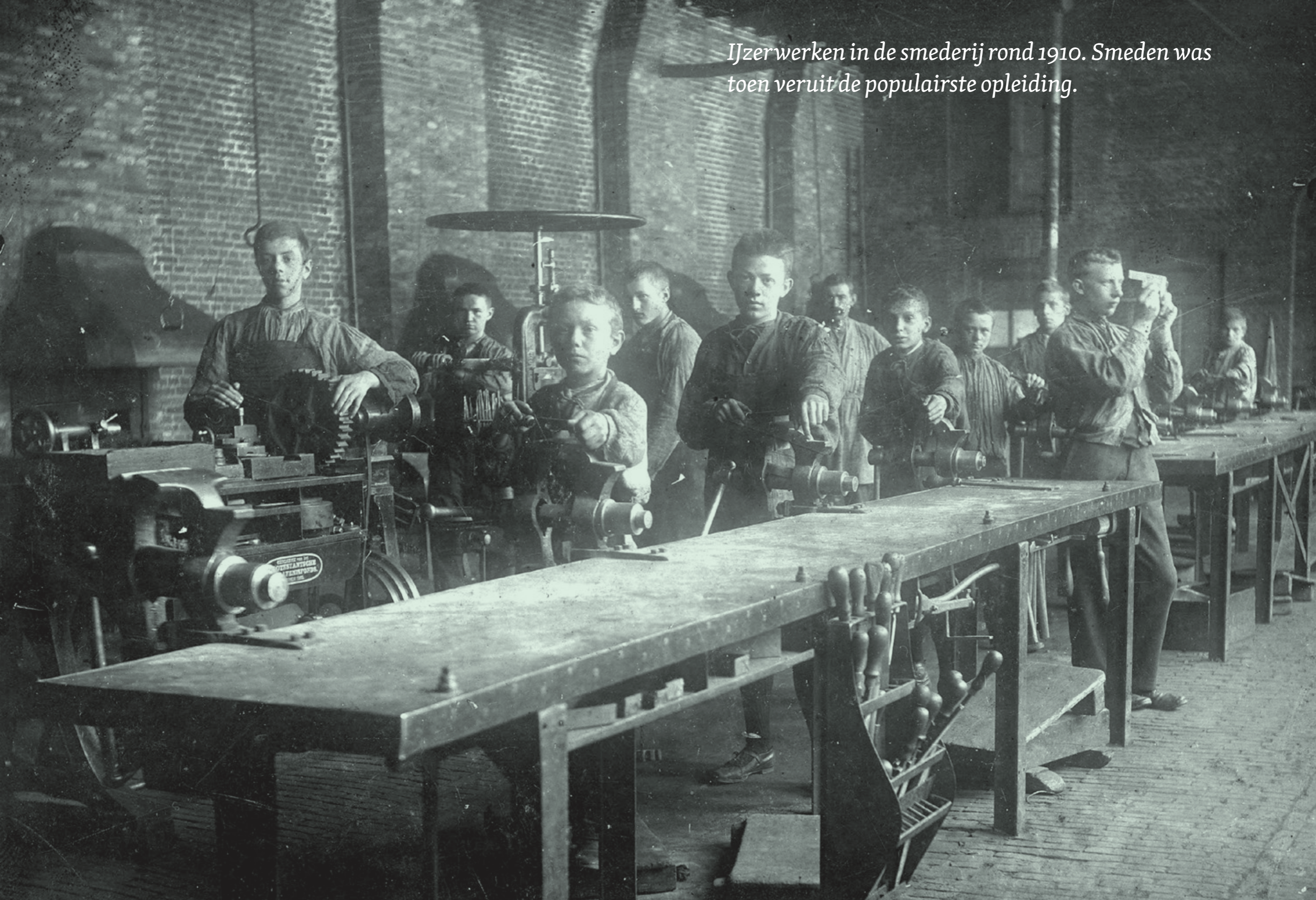
IJzerwerken in de smederij rond 1910. Smeden was toen veruit de populairste opleiding.