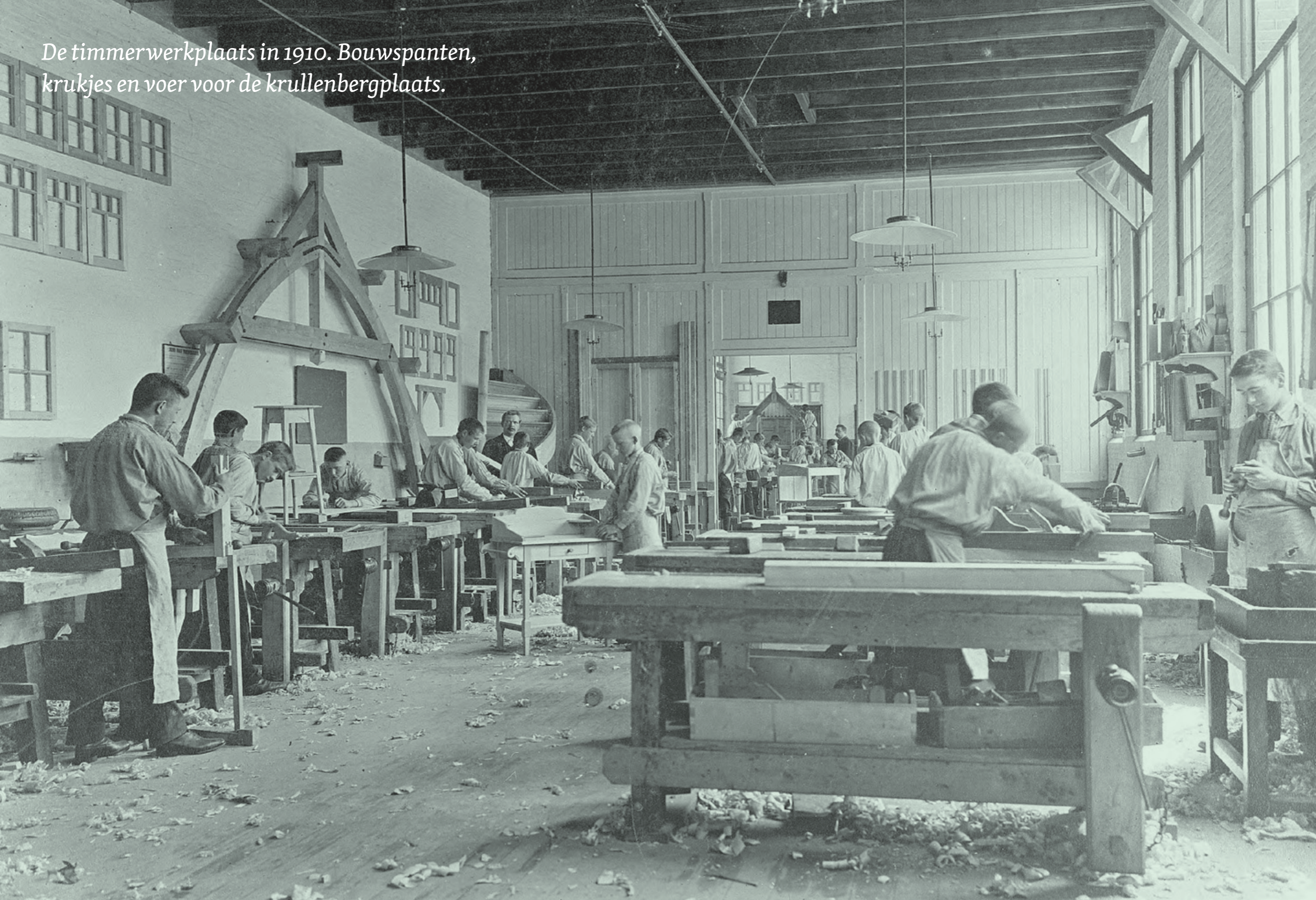
De timmerwerkplaats in 1910. Bouwspanten, krukjes en voer voor de krullenbergplaats.