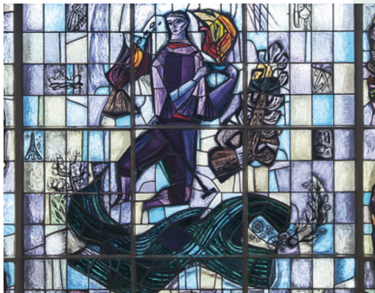
De jonge werkman doet denken aan Prometheus uit de Griekse mythologie.